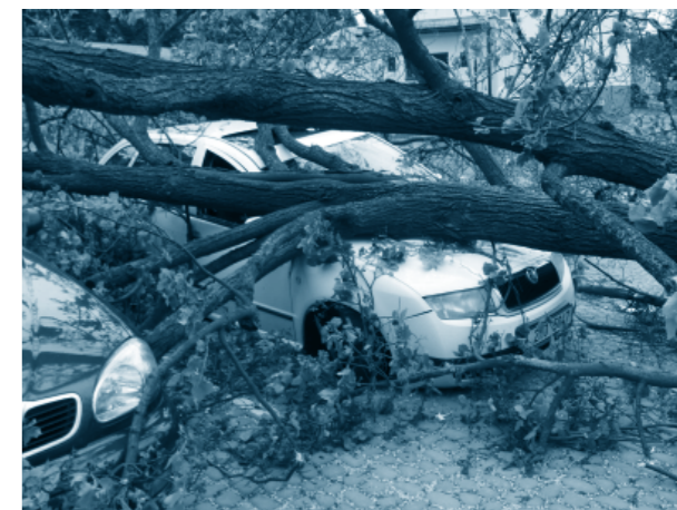
Strom spadl na zaparkovaná auta v Adršpachu u dětského hřiště