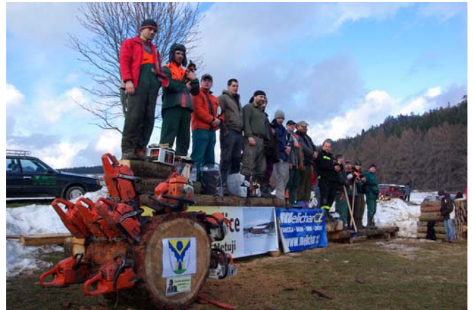
Příloha: foto Dřevorubec

Akce dopadla na výbornou a za to patří díky spoustě lidí. Mezi hlavní sponzory Dřevorubce patří: